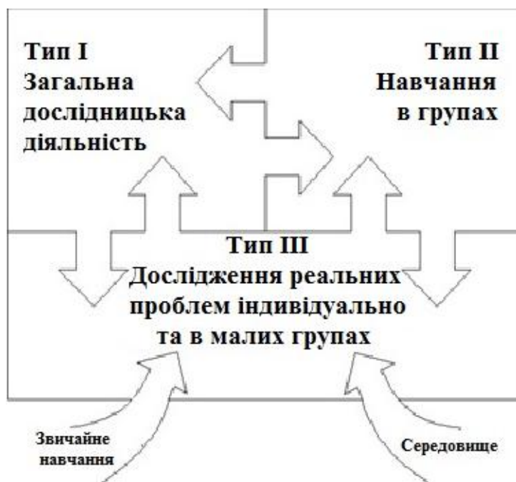
Рис. 2. Тріадна модель збагачення шкільної освіти

необхідності супроводити власну теоретичну модель обдарованості практично-прикладним блоком. Так народилася ідея створити програму-модель розвитку креативної продуктивності в обдарованих учнів, яку можливо застосовувати в звичайних загальноосвітніх школах. Зовсім не йшлося про те, що ця модель буде підмінити існуючий курикулум, або окремі його частини, а лише про те, щоб збагатити, урізноманітнити навчання учнів у школі, відкриваючи їм доступ до різних тематик, дослідницьких проєктів, розширеного змісту навчання з можливістю опановувати його випереджальними темпами. Цей задум було втілено в тріадній моделі збагачення шкільної освіти - Schoolwide Enrichment Triad Model (див. рис. 2), яку Рензулі розробив у співробітництві з фахівцями різної спеціалізації - науковцями, експертами, адміністраторами, вчителями-предметниками, методистами, програмістами, тощо [4; 9, с. 14].